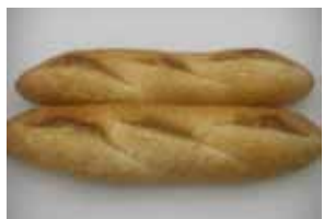
フランスパン ¥230 長時間熟成のバゲットです ×卵 ×牛乳 ×バター