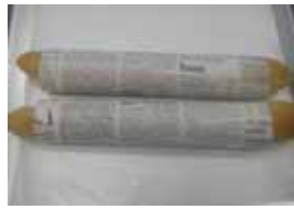
ミルクフランス ¥130 手作りミルククリームです。 くせになるおいしさ(・v・) ×卵 ○牛乳 ○ラード