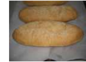
きなここっぺ ¥120 給食に出てましたよね(^^) おいしいですよ♪ ○卵 ○牛乳 ○バター