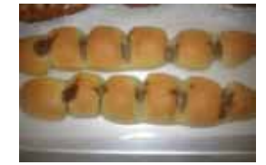
エッセン ￥200 シャウエッセンを 丸ごと1本使用。 ×卵 ○牛乳 ○バター