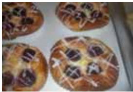
ダークチェリー ￥140 甘酸っぱいチェリーが クリームにマッチ ○卵 ○牛乳 ○バター