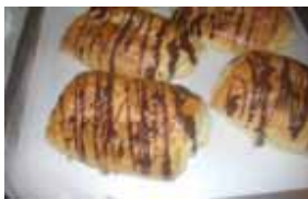
パンオショコラ ￥150 ベルギー産チョコが中に^^* 子供から大人まで幅広く人気。 ○卵 ○牛乳 ○バター