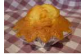
マドレーヌ ￥300 「別立て」でつくった本格派。 5ヶ入りです。 ○卵 ×牛乳 ○バター