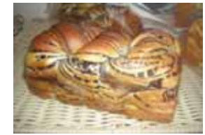
チョコマブル ¥300 ロールの生地チョコを 巻き込みました。 ○卵 ○牛乳 ○バター