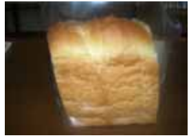
ホテル食パン ¥230 食パンより甘くてやわらかい。 バターがきれいに溶け込みます。 ○卵 ○牛乳 ○バター