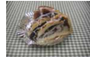
モン カット売り ¥170 ×卵 ○牛乳 ○バター