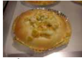
コーンぱん ¥130 甘くてちょっと塩味の おやつパン ○卵 ○牛乳 ○バター