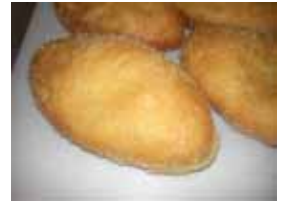
辛口カレー ¥110 とっても辛いと噂に… 辛党さんにオススメです！ ○卵 ×牛乳 ○バター