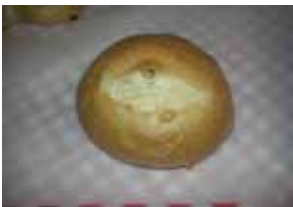
くるみぱん ¥60 食感サクめのくるみぱん サンドにしても◎(*´v`) ○卵 ○牛乳 ○バター