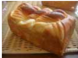
ミルクブレッド ¥300 北海道ミルククリームを 巻き込みました。 ○卵 ○牛乳 ○バター