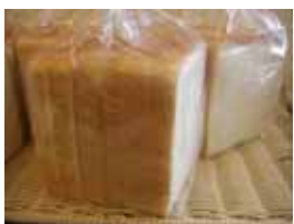
食パン ¥210 角型食パン。 価格は1斤分です。 ×卵 ○牛乳 ○バター