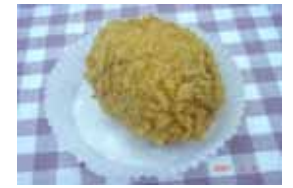
牛肉コロッケ ￥100 普通のコロッケです。 ○卵 ×牛乳 ○ラード