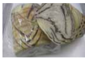
チョコラウンド ¥500 チョコレートを折り込みました メイプルより甘いです♪ ○卵 ○牛乳 ○バター