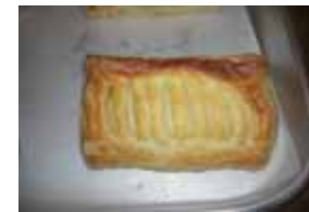
クリームチーズパイ ¥160 クリームチーズは甘く仕上げ てます。 ○卵 ○牛乳 ○バター