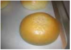
あんぱん ¥110 北海道十勝の有機小豆です。 ○卵 ×牛乳 ○バター