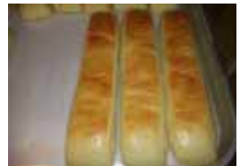
ミルクスティック ¥110 焼きドーナツにミルククリーム ○卵 ○牛乳 ○バター