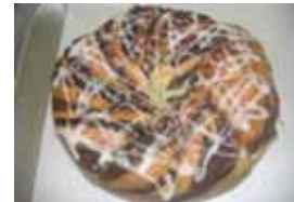
モン ¥1,020 ケシの種とアーモンドクリーム ×卵 ○牛乳 ○バター