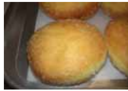
カレーパン ￥110 辛さは普通です カリカリした表面がグッド(∀)b ○卵 ○牛乳 ○ラード