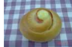
エスカルゴ ￥60 ハムとマヨネーズがパンチ 効いてますっ(´Σ´)!! ○卵 ○牛乳 ○バター