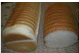
ラウンドパン ¥320 円筒形のやわらかい食パン 焼いてもサンドでもOK ○卵 ○牛乳 ○バター