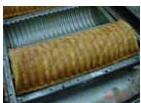
デンマーク食パン 非売品 ネット販売のみ 参考価格 ¥900 ○卵 ○牛乳 ○バター