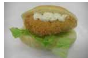
フィッシュバーガー ¥100 ロールパンに白身フライ ○卵 ○牛乳 ○バター