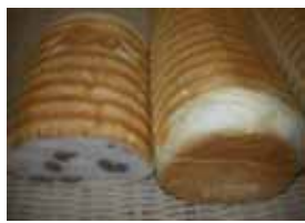
金時豆の丸ぱん ¥700 十勝の厳選金時豆を使用。 ○卵 ○牛乳 ○バター