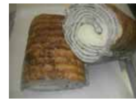
黒胡麻ラウンド ¥500 胡麻ペーストを巻きました 香りがいいです。 ○卵 ○牛乳 ○バター