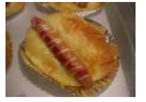
ソシソン ¥140 ロールパンにシャウエッセン ○卵 ○牛乳 ○バター