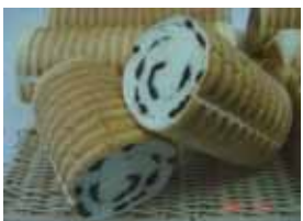
レーズンラウンド ¥500 ラム酒漬けレーズンの甘さが 食べやすい食パン ○卵 ○牛乳 ○バター