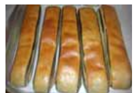
チョコスティック ¥110 チョコを折り込んで焼いた ドーナツです。 ○卵 ○牛乳 ○バター