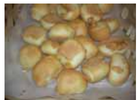
ココロチーズ ¥150 5個入り チーズがとろけます(*´`*)b ×卵 ○牛乳 ○ラード