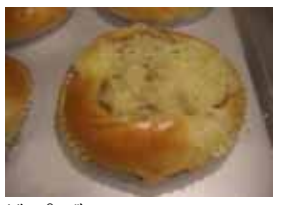
ネギピザ ¥120 たまねぎと胡椒入りマヨネーズ ○卵 ○牛乳 ○バター