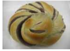
紫芋ぱん ¥110 鹿児島特産紫芋使用 ○卵 ×牛乳 ○バター