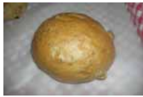
カマンベールくるみ ¥150 この組み合わせはいいです。 ○卵 ○牛乳 ○バター