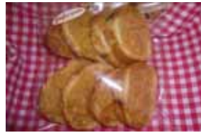
フロランタン ￥170 キャラメルとアーモンドを フランスパンにのせて焼きました。 ○卵 ○牛乳 ○バター