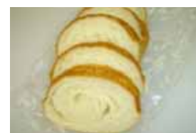
牛乳ラウンド ¥500 北海道牛乳クリームです。 ミルクの匂いが香ばしいです^^* ○卵 ○牛乳 ○バター