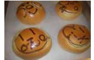
チョコパン ¥110 中身も絵もチョコです。 子供に大人気★ ○卵 ×牛乳 ○バター