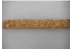
デニッシュスティック ¥80 キャラメルをのせて焼きました。 サクサクです(・ω・) ○卵 ○牛乳 ○バター