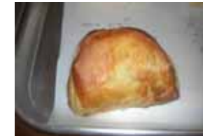
アップルパイ ¥160 りんごたくさんです。 ○卵 ○牛乳 ○バター