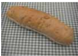
みるくるみ ¥130 コンデンスミルクを使った クリーム入りです。 ○卵 ×牛乳 ○バター