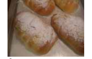
アップルローフ ¥160 カスタードクリームに りんごのコンポート ○卵 ○牛乳 ○バター