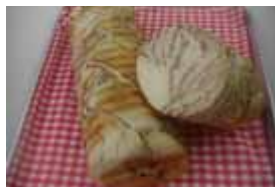
メイプルラウンド ¥500 メイプルシロップを折り込んだ No.01の人気商品。食べなきゃ損!! ○卵 ○牛乳 ○バター