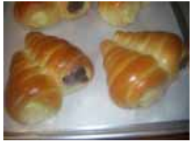
コロネ ¥120 クリームとチョコのツイン 1日6個限定 ○卵 ×牛乳 ○バター