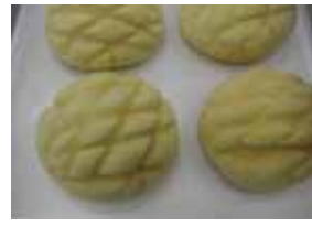
メロンパン ¥130 外はサクサク、中はふわふわ こだわりのメロンパンです ○卵 ×牛乳 ○バター