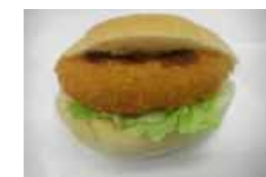
コロッケサンド ¥100 野菜コロッケをはさみました ○卵 ○牛乳 ○バター