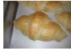
クロワッサン ¥130 バターを使った本格派 サンドにしても美味しいbb ×卵 ○牛乳 ○バター