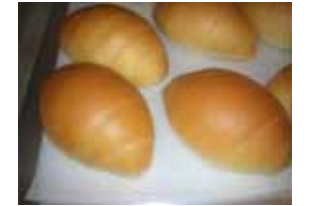
バターロール ¥50 焼いてよし、サンドでもO.K ○卵 ○牛乳 ○バター