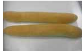
塩キャラフランス ￥130 今話題の「塩キャラメル」!! また食べたくなるおいしさ♪ ×卵 ○牛乳 ○バター