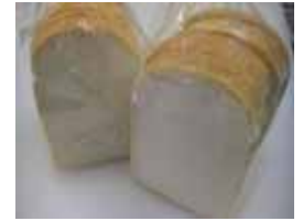
ハードトースト ¥250 厳選した材料で作った食パン トーストするとサクサクです。 ×卵 ○牛乳 ○ラード