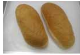
めんたいこパン ¥120 めんたいマヨネーズです。 美味しいです。 ○卵 ○牛乳 ○バター