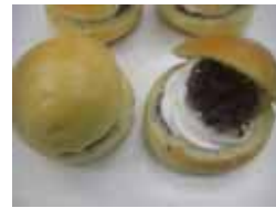
生クリームあん ￥90 アンコ増量で中に 生クリームをいれました。 ○卵 ○牛乳 ○バター