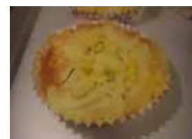
チーズコーンピザ ¥140 塩味コーンに玉葱と ダブルチーズ ○卵 ○牛乳 ○バター