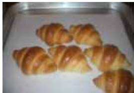
ミニクロワッサン ¥30 ちょっぴり甘い小さな クロワッサン ○卵 ×牛乳 ○バター