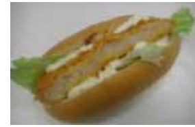
エビサンド ￥200 1回食べたら癖になる!! 前日注文オンリー承り(・ω・`) ○卵 ○牛乳 ○バター