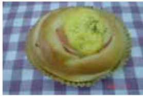
ハムエッグ ￥130 毎日手作りのたまごサラダと ハムがマッチ(´∀´)b ○卵 ○卵 ○バター