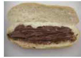
チョコこっぺ ¥120 甘いのが足りない方へ(ω^) ○卵 ○牛乳 ○バター