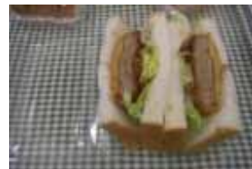
メンチカツサンド ￥180 朝ごはんにジューシーな メンチカツのサンドをぜひ★ ○卵 ○牛乳 ○バター