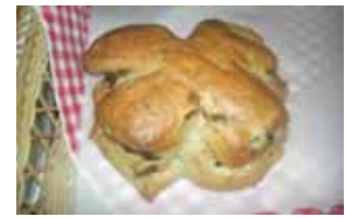
ノアレザン ¥200 レーズンをたっぷりくるみぱんに 混ぜました。 ○卵 ○牛乳 ○バター