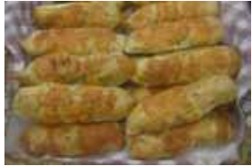
モッチーズ ￥30 ほんとにおもちゃみたいな触感 です。 ○卵 ×牛乳 ○油脂