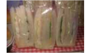
三角サンド ￥230 ハムエッグとハムチーズ バージョン。 ○卵 ○牛乳 ○バター