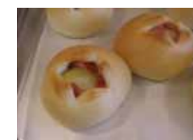
じゃが丸くん ¥140 じゃがいもまるごと1個に ベーコンを巻きこみました。 ×卵 ○牛乳 ○ラード