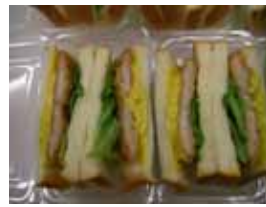
カツカレーサンド ¥230 とんかつとたっぷりの カレーソースです。 ○卵 ○牛乳 ○バター