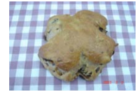
ノアレザン ¥189 レーズンをたっぷりくるみぱんに 混ぜました。