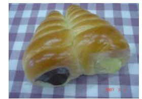
コロネ ¥105 クリームとチョコのツイン 1日6個限定