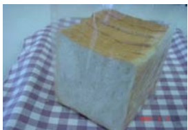
食パン ¥189 角型食パン。 価格は1斤分です。 ×卵 ○牛乳 ○バター