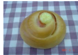
エスカルゴ ¥42 小さいハムロールです ○卵 ○牛乳 ○バター