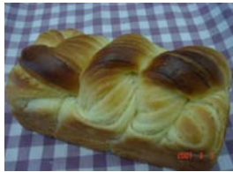
ミルクブレッド ¥294 北海道ミルククリームを 巻き込みました。 ○卵 ○牛乳 ○バター