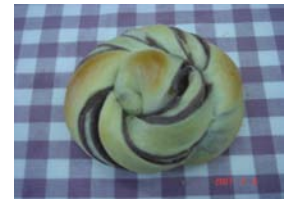
紫芋ぱん ¥105 鹿児島特産紫芋使用