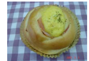
ハムエッグ ¥126 ハムロールにプラスサンド用 卵サラダ