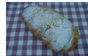
アップルローフ ¥157 クリームとオランダ産 リンゴジャム