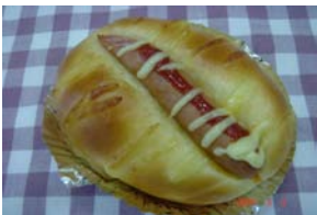
ソシソン ¥137 ロールパンにシャウエッセン