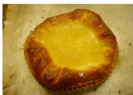
洋なしパン ¥137 ラフランスのジャムパンです。 上はクッキーです。 ○卵 ○牛乳 ○バター