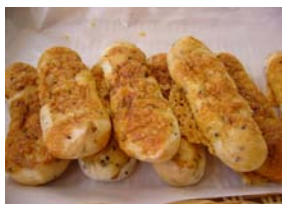
モチーズ ¥16 ほんとおもちみたいな触感 です。 ○卵 ×牛乳 ○油脂