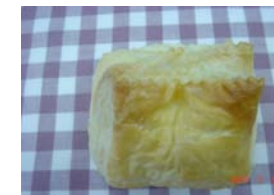
クリームチーズパイ ¥157 クリームチーズは甘く仕上げ てます。 ○卵 ○牛乳 ○バター