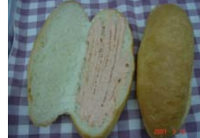
めんたいこパン ¥105 めんたいマヨネーズです。 美味しいです。 ○卵 ○牛乳 ○バター