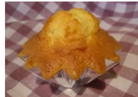
マドレーヌ ¥262 「別立て」でつくった本格派。 5ヶ入りです。 ○卵 ×牛乳 ○バター