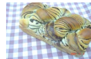
チョコマール ¥294 ロールの生地にチョコを 巻き込みました。 ○卵 ○牛乳 ○バター