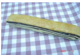
チョコスティック ¥105 チョコを折り込んで焼いた ドーナツです。 ○卵 ○牛乳 ○バター