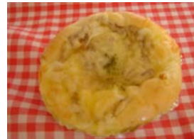
ネギピザ ¥105 たまねぎと胡椒入りマヨネーズ