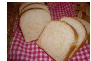
牛乳食パン ¥210 ライ麦全粒粉を使い、牛乳で 作りました。火曜日限定 ○卵 ○牛乳 ○バター