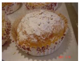
クロワッサンB. C ¥150 バターケーキ入りクロワッサン ○卵 ○牛乳 ○バター