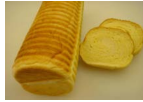
マロンの丸パン ¥500 栗のクリームを巻きました。 半分(250円)売り可