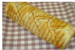
メイプルラウンド ¥420 メイプルシロップを折り込んだ 当店の人気NO.1 ○卵 ○牛乳 ○バター