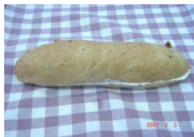
みるくるみ ¥126 コンデンスミルクを使った クリーム入りです。 ○卵 ×牛乳 ○バター