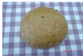
カマンベールくるみ ¥147 この組み合わせはいいです。