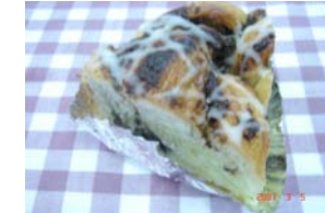
モン カット売り ¥157 ×卵 ○牛乳 ○バター