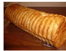
デンマーク食パン 非売品 ネット販売のみ 参考価格 630円 ○卵 ○牛乳 ○バター