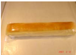
ミルクスティック ¥105 焼きドーナツにミルククリーム ○卵 ○牛乳 ○バター