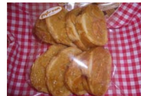
フロランタン ¥157 キャラメルとアーモンドを フランスパンにのせて焼きました。 ○卵 ○牛乳 ○バター