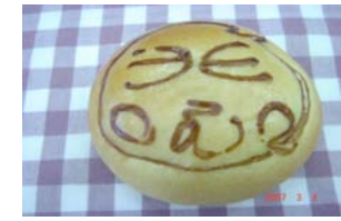
チョコパン ¥105 中身も絵もチョコです。