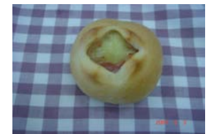
じゃが丸くん ¥137 じゃがいもまるごと1個に ベーコンを巻きこみました。 ×卵 ○牛乳 ○ラード