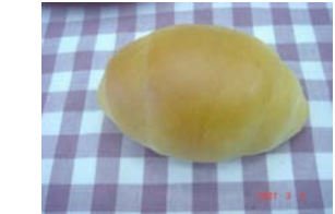
バターロール ¥42 焼いてよし、サンドでもOK