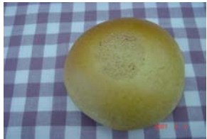
あんぱん ¥105 北海道十勝の有機小豆です。