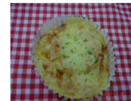
たらもピザ ¥140 辛子明太子とじゃがいもの ピザ。 ×卵 ○牛乳 ○ラード