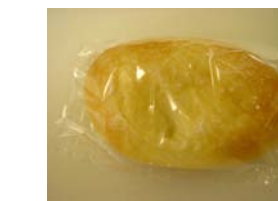
スイートポテト ¥126 鹿児島のだつまいもを使った あんぱんです。 ○卵 ○牛乳 ○バター