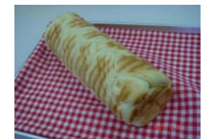
ミルクラウンド ¥420 ミルククリームはカスタード よりさわやかな甘さです。 ○卵 ○牛乳 ○バター