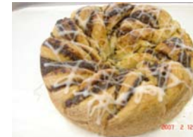
モン ¥945 ケシの種とアーモンドクリーム ×卵 ○牛乳 ○バター