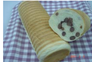
金時豆の丸ぱん ¥630 十勝の厳選金時豆を使用。 ○卵 ○牛乳 ○バター