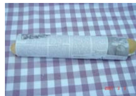
ミルクフランス ¥126 手作りミルククリームです。 ×卵 ○牛乳 ○ラード