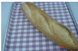
フランスパン ¥210 長時間熟成のバゲットです ×卵 ×牛乳 ×バター