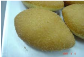
辛口カレー ¥105 とっても辛いと噂に…