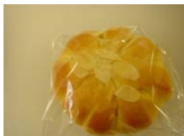
パンプキンぱん ¥126 北海道のかぼちゃを 使いました。 ○卵 ○牛乳 ○バター