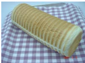
ラウンドパン ¥294 円筒形のやわらかい食パン 焼いてもサンドでもOK ○卵 ○牛乳 ○バター