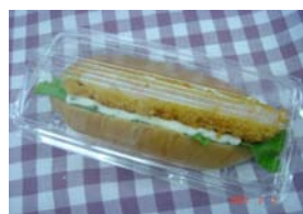
えびサンド ¥189 小エビたっぷりのサンド ○卵 ○卵 ○バター