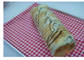
チョコラウンド ¥420 チョコレートを折り込みました メイプルより甘め ○卵 ○牛乳 ○バター