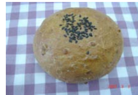
くるみあんぱん ¥126 フランスあんぱん風ですが もっと食べやすいです。