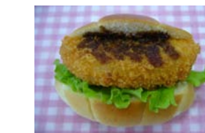
コロッケサンド ¥84 野菜コロッケをはさみました ○卵 ○牛乳 ○バター