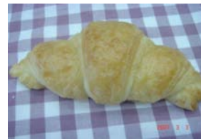
クロワッサン ¥126 バターを使った本格派 ×卵 ○牛乳 ○バター