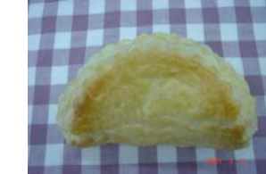
アップルパイ ¥157 りんごたくさんです。 ○卵 ○牛乳 ○バター