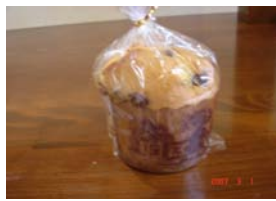
チョコマフィン ¥137 甘いのが！ ○卵 ○牛乳 ○バター