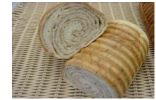
コーヒーラウンド ¥420 コーヒークリームを 渦巻状に巻きました 予約のみ ○卵 ○牛乳 ○バター