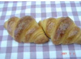
ミニクロワッサン ¥26 ちょっぴり甘い小さな クロワッサン ○卵 ×牛乳 ○バター