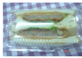
メンチカツサンド ¥168 メンチカツのサンド ○卵 ○牛乳 ○バター