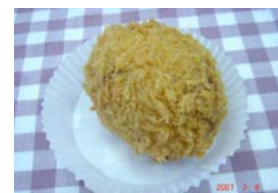
牛肉コロッケ ¥105 普通のコロッケです。 ○卵 ×牛乳 ○ラード