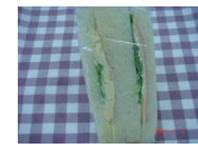
三角サンド ¥210 ハムエッグとハムチーズ バージョン。 ○卵 ○牛乳 ○バター