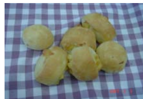
コロコロチーズ 1g 1円 ソフトフランスにさいの目 チーズ ×卵 ○牛乳 ○ラード