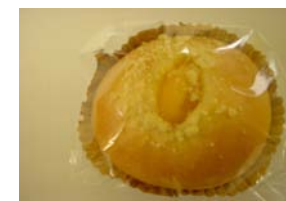
マンゴークリームパ ¥126 カスタードクリームに マンゴー果実入り。9月まで ○卵 ○牛乳 ○バター