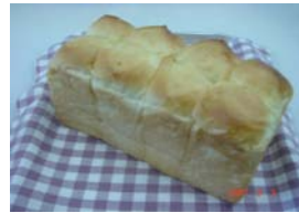
ホテル食パン2斤分 ¥409 食パンより甘くてやわらかい。 バターがきれいに溶け込みます。 ○卵 ○牛乳 ○バター