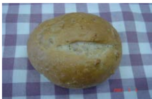
くるみぱん ¥52 食感サクめのくるみぱん