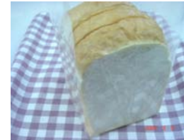
ハードトースト ¥231 厳選した材料で作った食パン トーストするとサクサクです。 ×卵 ○牛乳 ○ラード