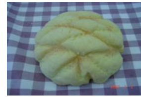
メロンパン ¥126 中はふわっと、外は サクサク