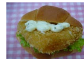
フィッシュバーガー ¥84 ロールパンに白身フライ ○卵 ○牛乳 ○バター