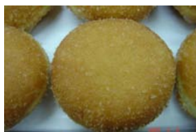
カレーパン ¥105 辛さは普通です ○卵 ○牛乳 ○ラード