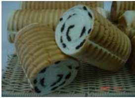
レーズンラウンド ¥420 ラム酒漬けレーズンの甘さが 食べやすい食パン ○卵 ○牛乳 ○バター